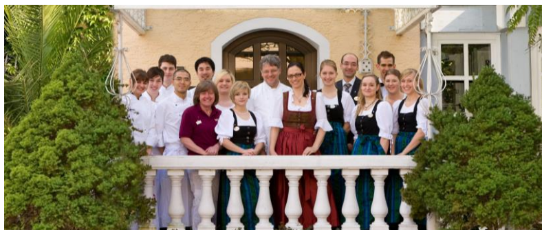
IHR TEAM VOM ROMANTIK HOTEL & RESTAURANT FÜRSTENHOF LANDSHUT

Sie fordern Ihre Tagungsteilnehmer – fordern Sie uns!